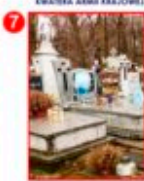
CIERNO - ŻABIENIEC; CMENTARZ NA KTÓRYM ZNAJDUJE SIĘ MOGIŁA NIEZNANEGO ŻOŁNIERZA