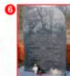
WILANÓW - GAJ LEŚNICZÓWKA GAJ, W KTÓREJ MIEJSCA BEZPOŚCIE I WYBITY ŚWIATŁOWEJ BRATNA ARMII KRAJOWEJ

Dofinansowano ze środków Ministra Kultury, Dziedzictwa Narodowego i Sportu w ramach programu Narodowego Centrum Kultury „Kultura – Interwencje 2021”